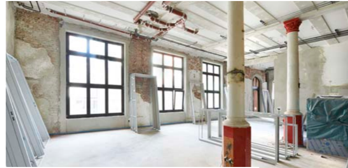
Umbau, Sanierung und Erweiterung, Alten Hafenamtes, Hamburg

spine architects lieben Urbanität, kurze Wege und den traditionellen Montagskuchen im Büro.