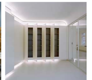
Umbau und Sanierung, Hamburg