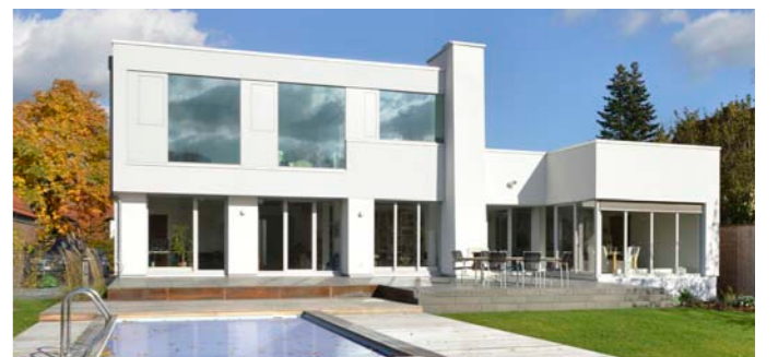
Umbau und Erweiterung eines Wohnhauses, Rotenburg an der Wümme