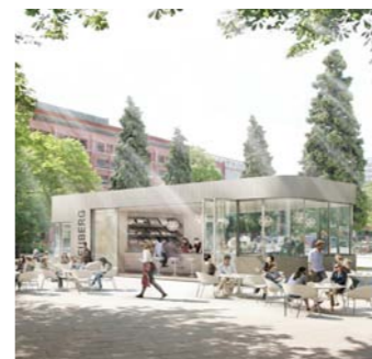
Temporärer Pavillon, Konzept, Hamburg