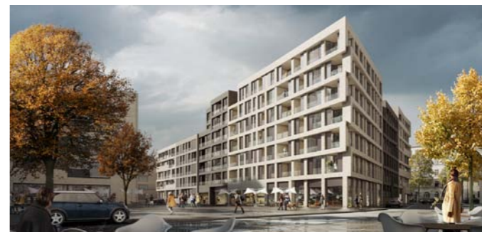
Entwicklung einer Wohnbebauung, Wettbewerb, Hamburg