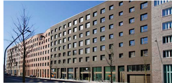
Neubau eines Wohn- und Geschäftshauses, Hamburg