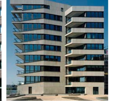
Neubau eines Wohngebäudes, Hamburg