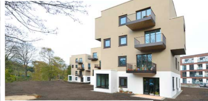
Wohnbebauung, Punkthäuser in Massivholzbauweise, Hamburg