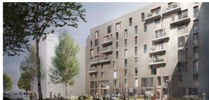
Wohnungsbau mit 38WE, Wettbewerb, Hamburg