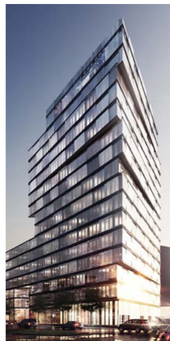
Gebäudeensemble, Wettbewerb, Hamburg