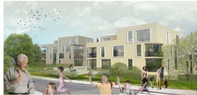
Städtebaulicher Wettbewerb, Neubau von 11 MFH/120 WE, Sondershausen